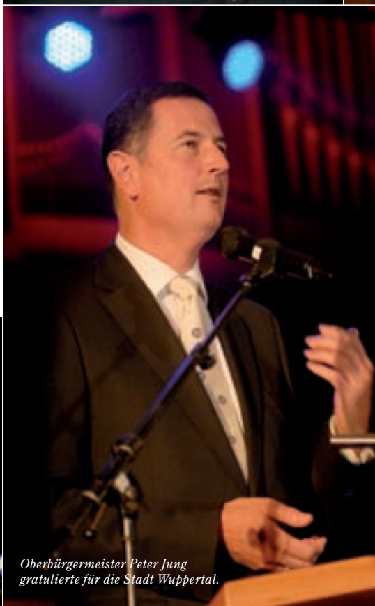
Oberbürgermeister Peter Jung gratulierte für die Stadt Wuppertal.