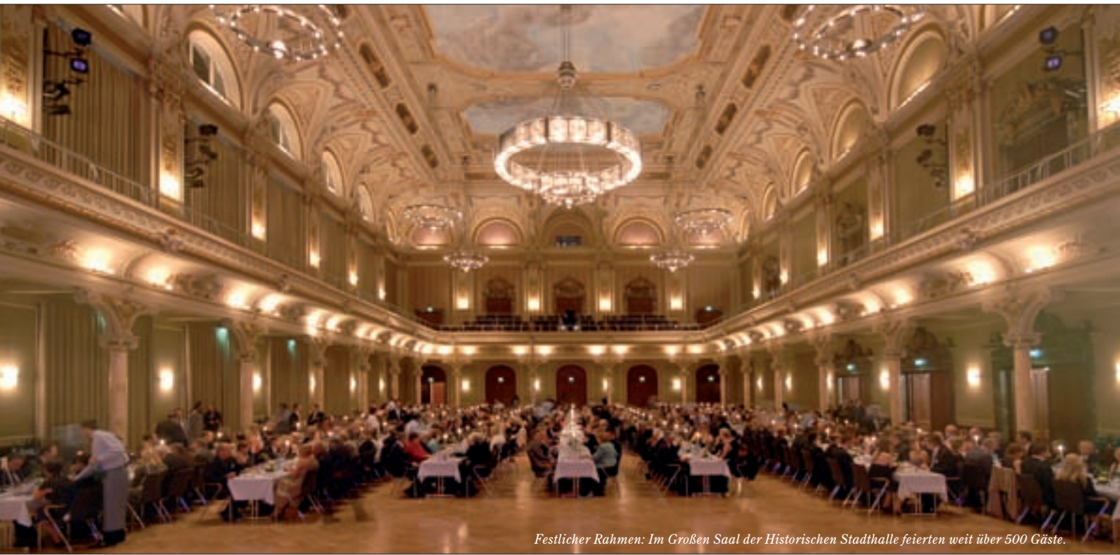
Festlicher Rahmen: Im Großen Saal der Historischen Stadhalle feierten weit über 500 Gäste.