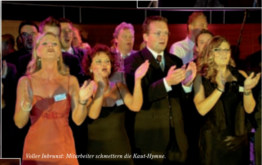
Voller Inbrunst: Mitarbeiter schmettern die Kaut-Hymne.