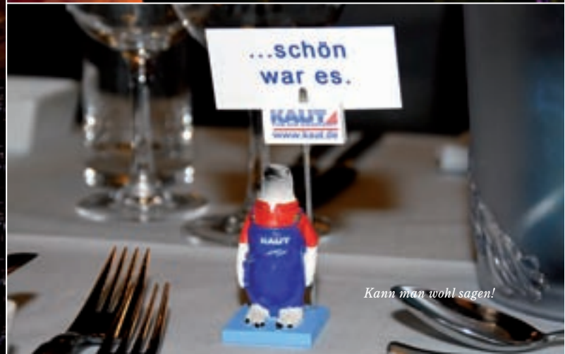
Kann man wohl sagen!